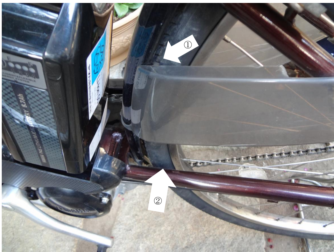
①擦れていたドレスガードのフック ②タイヤが手前に傾いていた